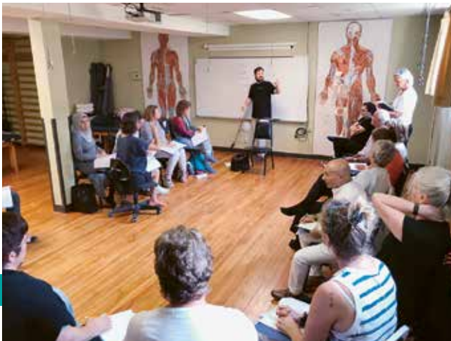
Initiation à la méthode Polarity