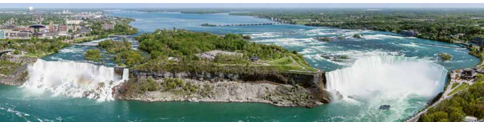
Chutes du Niagara

Après plus de 10 années passées à sillonner l'Asie, de l'Inde au Japon, en passant par le Vietnam, la Thaïlande et la Chine, la Fondation ASCA a emmené ses thérapeutes à la découverte de l'Amérique du Nord et de deux méthodes qui en sont issues, la Polarité et le Trager. Destination: le Canada!