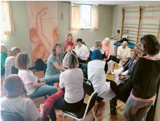
Initiation à la méthode Trager