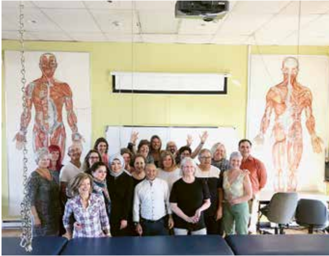
Groupe ASCA au Canada