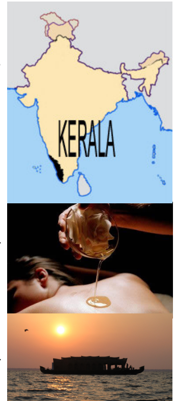
Le Kerala, c'est l'Inde de la douceur de vivre.

Veillez remplir le talon annexé et le retourner au plus vite. Le nombre de places est limité à 40 personnes.