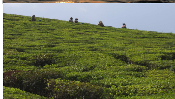
Kerala, Inde, avril 2007