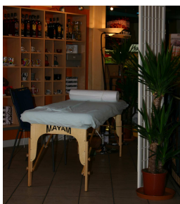
Coffee & Time MIGROS Avry-Centre, Fribourg

permet d'envisager 2008 sous un angle un peu plus ambitieux. Le thème de l'année prochaine sera communiqué ultérieurement mais l'enthousiasme qu'il suscitera est d'ores et déjà garanti.