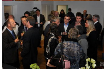
Conférence de presse et inauguration du CMI ASCA le 13 octobre 2010.